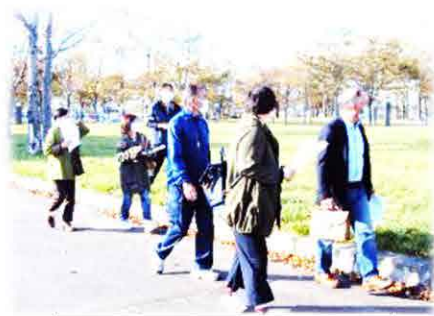
鳥取北9丁目町内会